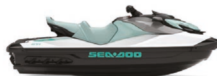
Ярко-белый / Нео-мятный