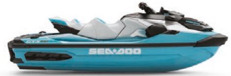
● Бирюзовый металллик