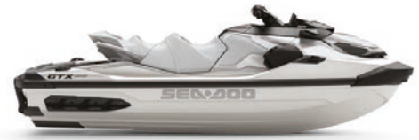
○ Жемчужный белый премиум