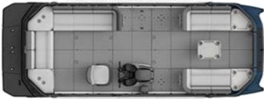
SWITCH CRUISE 21-170