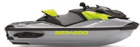
● Ледяной металл / Зеленый