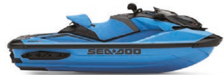
● НОВИНКА Голубой гольфстрим премиум