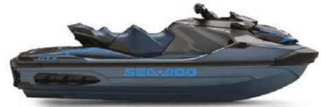
● Голубая бездна / Голубой гольфстрим